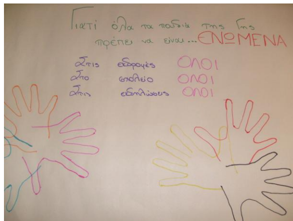
Εικόνες 25, 26 και 27.

Τα παιδιά συνεργάζονται και κατασκευάζουν αφίσες