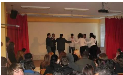
Εικόνες 50, 51, 52, 53 και 54.