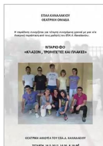
Εικόνα 49. Αφίσα της θεατρικής ομάδας