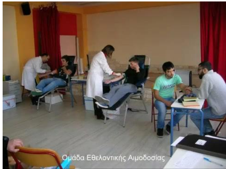
Εικόνες 60 και 61.

Εθελοντική αιμοδοσία: ανακοίνωση και δράση