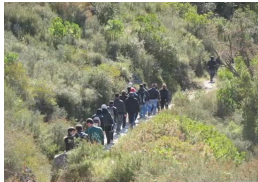
Εικόνες 55, 56, 57, 58 και 59. Οι μαθητικές ομάδες σε δράση

έρευνες έχει καταγράψει αλλαγή των στάσεων σχετικά με την εκτίμηση στη μαύρη φυλή, σε συμμετέχοντες με καταγεγραμμένες ρατσιστικές απόψεις για τους μαύρους, μετά από παρακολούθηση ολυμπιακών αθλημάτων στα οποία οι μαύροι είχαν επιτυχίες (Κοκκινάκη 2005). Έτσι και στο ενδοσχολικό επίπεδο, σιωπηλά ή εκφρασμένα, οι μαθητές αποδέχτηκαν τους αλλοδαπούς συμμαθητές τους που παρουσίασαν κάποια καλή απόδοση στα ομαδικά αθλήματα και εκπροσώπησαν επάξια το σχολείο σε αγώνες με σχολεία άλλης περιοχής. Κυρίαρχο στοιχείο ενότητας έγινε το σχολείο τους και όχι η εθνική τους καταγωγή. Κάποιες φορές, μάλιστα, μετά από επιτυχίες στους αγώνες πανηγύριζαν όλοι μαζί.