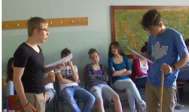
Εικόνες 44, 45 και 46.

Οι μαθητές δραματοποιούν στιχομυθίες της «Αντιγόνης»