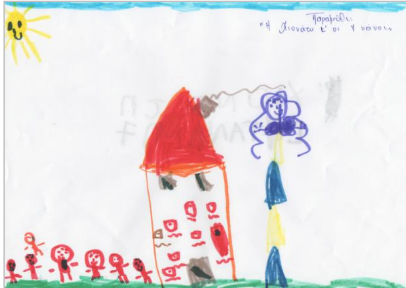
Εικόνα 3. Ζωγραφιά σκηνής παραμυθιού

παραγωγή γραπτού λόγου, καθώς ζήτησα από τα παιδιά, όσα μπορούσαν, να προσπαθήσουν να γράψουν τον τίτλο του παραμυθιού «Η χιονάτη και οι εφτά νάνοι». Για να μην αισθανθούν κάποια παιδιά μειονεκτικά για την αδυναμία παραγωγής γραπτού λόγου, ζήτησα να ζωγραφίσουν σκηνές από το παραμύθι που τους έκαναν εντύπωση.