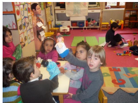
Εικόνα 5. Κουκλοθέατρο