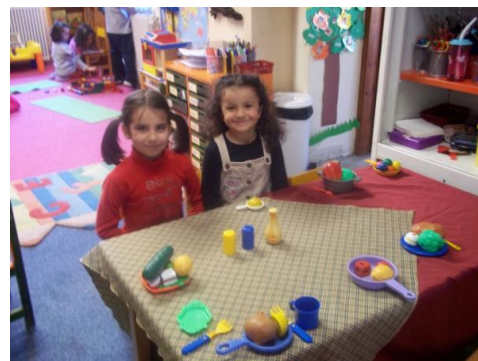
Εικόνα 4. Βιωματική δραστηριότητα

Για την καλύτερη εμπέδωση του αριθμού εφτά δημιουργήσα την εξής δραστηριότητα: στο τραπέζι δραστηριοτήτων ζήτησα από τα παιδιά να κάνουν αντιστοίχιση αντικειμένων και να ετοιμάσουν το τραπέζι για το γεύμα των εφτά νάνων. Να στρώσουν, δηλαδή, και να τοποθετήσουν εφτά πιάτα, εφτά ποτήρια, εφτά πιρουνία, και εφτά κουτάλια. Στην επέκταση αυτής της δραστηριότητας υπήρχαν σενάρια πιθανών καταστάσεων που υλοποίησαν και είχαν να κάνουν με προσθέσεις και αφαιρέσεις αριθμών με το εφτά. Για παράδειγμα, τοποθετούσα περισσότερα αντικείμενα στο τραπέζι (πιάτα, πιρουνία...) και θα έπρεπε κάποια να αφαιρεθούν για να γίνουν εφτά. Κάποιοι νάνοι είχαν πολλή δουλειά και δε θα έρχονταν για φαγητό, οπότε και θα έπρεπε να αφαιρεθούν κάποια σερβίτσια. Στο τραπέζι κάθονταν