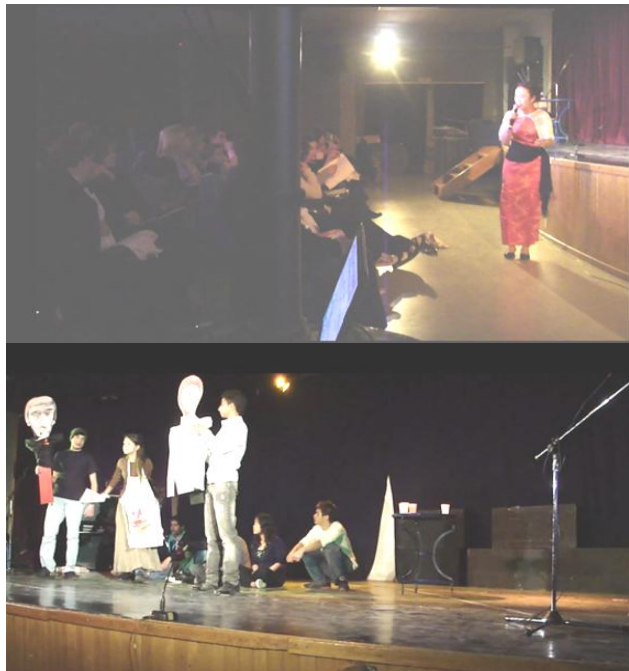
Εικόνες 62 και 63. Διαπολιτισμική και αντιρατσιστική θεατρική αγωγή

Συνοπτικά, τα προβλήματα που αντιμετωπίσαμε ήταν πολλά και διαφορετικά. Ξεκινάμε από την έλλειψη χώρων στο σχολείο μας, την τεράστια οικονομική δυσπραγία των μαθητών -κάποιοι και στα προηγούμενα έτη δεν είχαν ούτε το καθημερινό φαγητό, ενώ άλλοι διέμεναν σε ορφανοτροφεία, ξενώνες ή ήταν εγκαταλειμμένοι πρακτικά- και από το συνεχές σφυροκόπημα του σχολείου από γραφειοκρατικές δομές που απειλούν να το καταργήσουν, γεγονός που ενίσχυε –και ενισχύει– την ήδη μεγάλη ανασφάλεια των μαθητών.