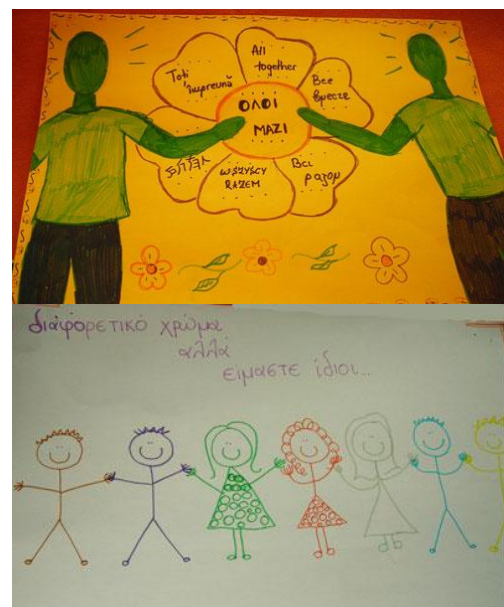
Εικόνες 65 και 66.

Η βασικότερη, όμως, παράμετρος αξιολόγησης είναι πως για όσο καιρό μας επέτρεψαν να αφοσιωθούμε απρόσκοπτα σε ό,τι κάναμε, η σχολική διαρροή μειώθηκε εντυπωσιακά, η βία ελαττώθηκε και αναπτύχθηκε αλληλεγγύη μεταξύ των μαθητών από διαφορετικούς πολιτισμούς, ενώ και άλλοι