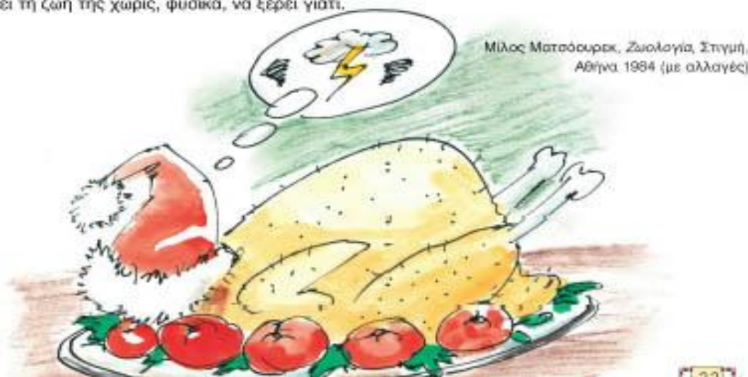
Μίλος Ματσόουρεκ, Ζωολογία, Στιγμή, Αθήνα 1984 (με αλλαγές)

Η γαλοπούλα είναι ένα εξαιρετικά ευερέθιστο πλάσμα, κάτι συμβαίνει με τα νεύρα της, κάτι δεν πάει καλά. Οπότε δει κόκκινο χρώμα θυμώνει. Το κακό είναι πως υπάρχουν ένα σωρό _____ πράγματα στον κόσμο, οι στέγες είναι _____, τα τριαντάφυλλα είναι _____, οι φράουλες είναι _____, υπάρχουν πολλά _____ πράγματα στον κόσμο και φαίνεται πως γίνονται συνεχώς όλο και περισσότερα. Η γαλοπούλα αναγκάζεται να τρέχει όλη την ώρα στον ψυχίατρό της, αλλά αυτός δεν μπορεί να τη βοηθήσει, γιατί η γαλοπούλα είναι πάντα γαλοπούλα. Τι να κάνει; Ορμάει σε ένα χρωματοπωλείο και αγοράζει άσπρη μπογιά, ξεθεύει όλες τις οικονομίες της για την _____ μπογιά και βάφει _____ τα βενζινάδικα, _____ τις ντομάτες, τα καρότα, _____ όλους τους δρόμους και βάφει _____ όλη την πολιτεία. Το αστείο είναι ότι και πάλι όλοι νομίζουν πως είναι Χριστούγεννα και η γαλοπούλα χάνει τη ζωή της χωρίς, φυσικά, να ξέρει γιατί.