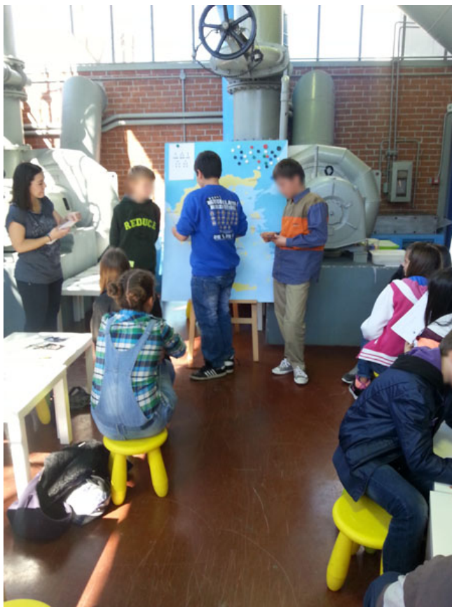
Οι μαθητές και οι μαθήτριες παρουσιάζουν το είδος και την οργάνωση της επιχείρησής τους

Αφού οι συμμετέχοντες οργανώσουν την επιχείρησή τους και δημιουργήσουν τη δική τους γραμμή παραγωγής, παρουσιάζουν στις υπόλοιπες ομάδες το είδος και την οργάνωση της επιχείρησής τους.