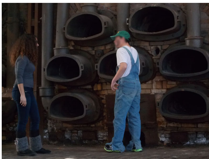
Μαθητές αναπαριστούν τη ζωή των εργατών