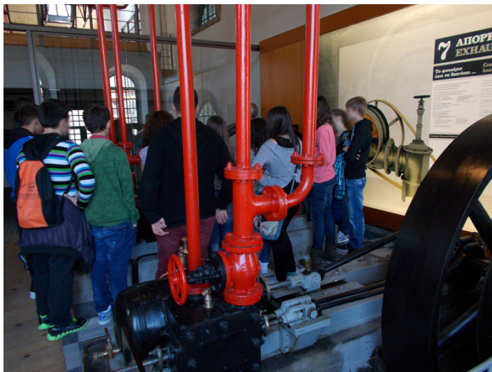
Εκπαιδευτική ξενάγηση στους χώρους του παλαιού εργοστασίου φωταερίου

Α) Εκπαιδευτική Ξενάγηση 10-11.15 π.μ. : Εκπαιδευτική ξενάγηση στους χώρους του εργοστασίου. Οι συμμετέχοντες χωρίζονται σε δύο ομάδες και κάθε μουσειολόγος-μουσειοπαιδαγωγός αναλαμβάνει να ξηναγήσει μία ομάδα στους χώρους του παλαιού εργοστασίου φωταερίου. Μέσω της ξενάγησης τα παιδιά πληροφορούνται για τα στάδια παραγωγής του φωταερίου, για την ιστορία των κτηρίων του εργοστασίου, για τον σωζόμενο μηχανολογικό εξοπλισμό, για τις ειδικότητες επαγγελματιών που εργάζονταν στο εργοστάσιο, τις συνθήκες εργασίας, τα χαρακτηριστικά γνωρίσματα της γύρω περιοχής του «Γκαζοχωρίου» (περιβαλλοντική ρύπανση, πολυπολιτισμικότητα, εγκληματικότητα και το Γκάζι σήμερα).