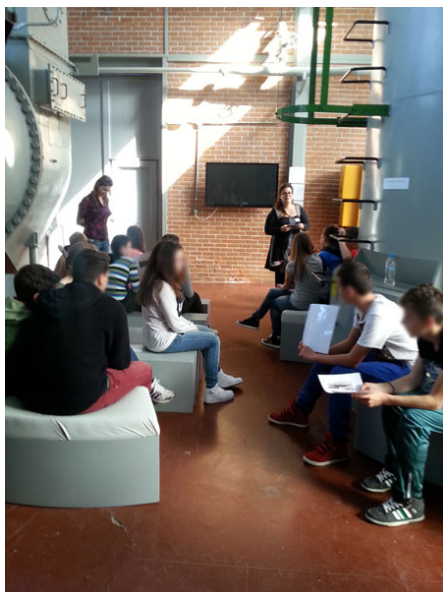
Προετοιμασία για το εκπαιδευτικό πρόγραμμα

«Αυτή η ανακάλυψη δεν περίμενε κανείς ότι θα έφερνε τόσο μεγάλες αλλαγές...»