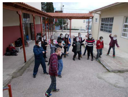
Οι μαθητές και οι μαθήτριες αναπαριστούν την κίνηση των μηχανών