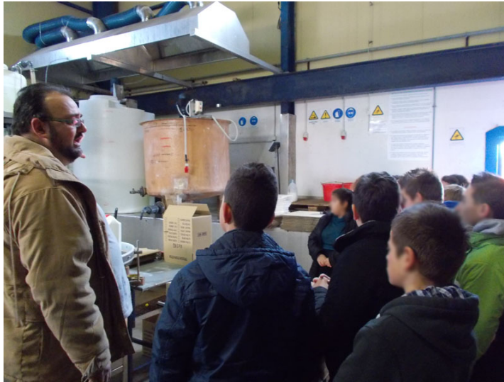
Επίσκεψη σε εργοστάσιο παραγωγής απορρυπαντικών των Οινοφύτων