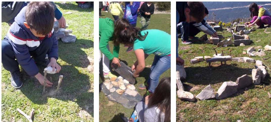
Ομαδικές δημιουργίες έργων land art

Η δραστηριότητα ολοκληρώθηκε με πλήθος φωτογραφιών, ερωτήσεων από τους μαθητές για το αν θα παραμείνουν τα έργα τους εκεί και θετικών σχολίων για την ημέρα που πέρασε. Τέλος, οι δάσκαλοι και οι μαθητές επιβιβάστηκαν στο λεωφορείο, αποχαιρέτησαν τις συνεργάτιδες της υποδράσης 9.5 και κατευθύνθηκαν προς το δρόμο της επιστροφής, αφού πρώτα άφησαν και τους μαθητές του Ελληνικού στο σχολείο τους.