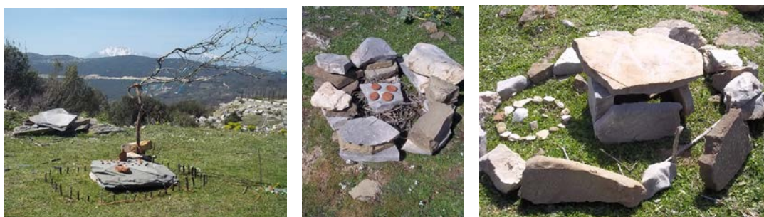
Τα τελικά έργα land art των μαθητών και μαθητριών

Οι μαθησιακοί πόροι που χρησιμοποιήθηκαν είναι φύλλα εργασίας και φυσικά υλικά γλυπτικής. Οι κύριες τεχνικές του εκπαιδευτικού προγράμματος στο μουσείο ήταν το θεατρικό παιχνίδι, η ομαδική εργασία, η παρατήρηση, η μαθητική παρουσίαση και η εικαστική έκφραση.