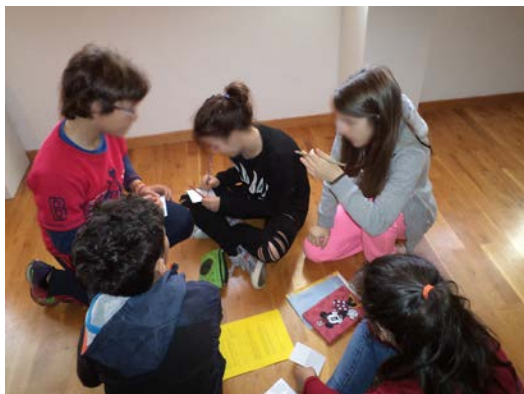
Ομαδική εργασία στο μουσείο

Κάποιες από τις ομάδες είχαν να διαπραγματευτούν παραπάνω από ένα έργα που σχετίζονταν, βέβαια, με το θέμα τους. Έτσι, έπρεπε να ψάξουν εντός του μουσείου να βρουν και μία δεύτερη καρτέλα του ίδιου χρώματος ώστε να ολοκληρώσουν την εργασία τους. Όλες οι ομάδες ολοκλήρωσαν εγκαίρως τις δραστηριότητες των καρτελών τους και παρουσίασαν με μεγάλη επιτυχία τα αποτελέσματα της έρευνάς τους προς τις υπόλοιπες ομάδες. Αναλόγως του θέματος, υπήρχαν διαφορετικές δραστηριότητες για κάθε ομάδα. Έτσι, κάποια ομάδα έγραψε και παρουσίασε μία ιστορία, κάποια άλλη ετοίμασε μία σύντομη θεατρική σκηνή χρησιμοποιώντας εκφράσεις με το ψωμί, άλλη ζωγράφισε τα περιεχόμενα της βαλίτσας του μετανάστη, ενώ ο κινέζος μαθητής ζωγράφισε πάνω σε χάρτη και παρουσίασε τη διαδρομή της οικογένειάς του από την Κίνα προς την Ελλάδα. Ο ίδιος μαθητής ζωγράφισε το κινητό του ως το πιο σημαντικό αντικείμενο που θα περιείχε η βαλίτσα. Μάλιστα, σε όλη τη διάρκεια του προγράμματος ήταν εμφανής ο στενός δεσμός με το κινητό του με το οποίο φωτογράφιζε συνεχώς. Ακόμη, υπήρξαν ομάδες που παρουσίασαν τη σημασία των εργαλείων για την αγροτική ζωή και κατ' επέκταση για την επιβίωση, τη σημασία της διατήρησης της πολιτιστικής μας κληρονομιάς, τις ομοιότητες και τις διαφορές της σχολικής ζωής στο παρελθόν και σήμερα, τους ρόλους της γυναίκας στο χθες και στο σήμερα και τον ρόλο των λόγιων και των ευεργετών στην Ήπειρο και αλλού.