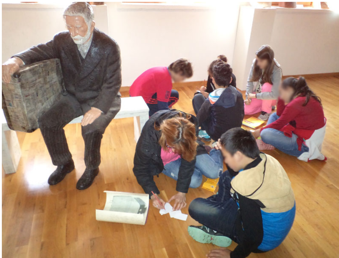
Η βαλίτσα του μετανάστη