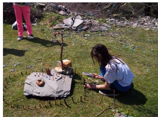
Ομαδικές δημιουργίες έργων land art