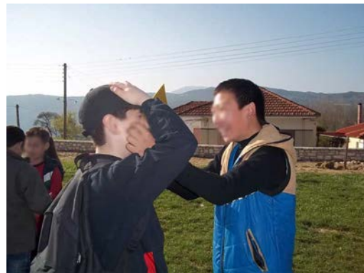
Ο γλύπτης, θεατρικό παιχνίδι στην αυλή του μουσείου

2 η φάση: Εργασία σε ομάδες εντός του μουσείου.