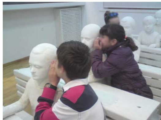
Μαθητές του τότε και του τώρα