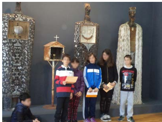
Παρουσίαση εργασιών στο μουσείο

3 η φάση: Δημιουργία έργων Land art (τέχνη της γης). Μετά την ολοκλήρωση της ομαδικής εργασίας εντός μουσείου, οι μαθητές του 9 ου Διαπολιτισμικού Δημοτικού Ιωαννίνων και του Δημοτικού σχολείου Ελληνικού Ιωαννίνων επιβιβάστηκαν στο λεωφορείο που είχε μεταφέρει τους πρώτους στο Ελληνικό. Το λεωφορείο κινήθηκε στη διαδρομή από το Ελληνικό προς το