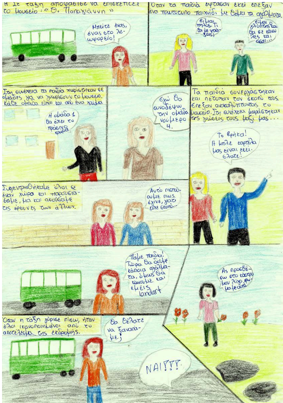
Τα κόμικς που δημιούργησαν τα παιδιά μετά την επίσκεψη στο μουσείο

Το πρόγραμμα διήρκεσε από τον Ιανουάριο μέχρι τον Απρίλιο του 2014