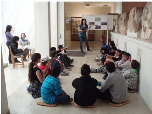
Εκπαιδευτικό πρόγραμμα στο Αρχαιολογικό Μουσείο Λαυρίου

Πραγματοποιήθηκε επίσκεψη των μαθητών στις 3/4/2014 στον αρχαιολογικό χώρο του Σουνίου και σύντομη ξενάγησή τους. Ακολούθησε εκπαιδευτικό πρόγραμμα στο Αρχαιολογικό Μουσείο Λαυρίου με επίκεντρο τη ζωφόρο του ναού του Ποσειδώνα σε σχέση με τους άθλους του Θησέα. Οι μαθητές συμμετείχαν σε ένα «κυνήγι θησαυρού» μέσα στο Μουσείο: αναζήτησαν επιλεγμένα εκθέματα τα οποία παρέπεμπαν στο θεό Ποσειδώνα, το ναό του στο Σούνιο, τη θεματολογία της ζωφόρου του ναού και τη σύνδεση όλων αυτών με τους άθλους του Θησέα. Ταυτόχρονα με το «παιχνίδι» αυτό, γινόταν διαρκώς συζήτηση με τα παιδιά προκειμένου να προσεγγίσουν αναλυτικά τις παραπάνω ενότητες χρησιμοποιώντας και όσα κουβαλούν μαζί τους ως «αποσκευές» από τους δικούς τους πολιτισμούς. Κατόπιν, τα παιδιά δημιούργησαν ένα πάζλ από τμήματα της ζωφόρου, όπως αυτά εκτίθενται στο Μουσείο του Λαυρίου.