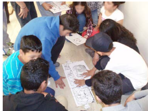
Δημιουργία πάζλ από τμήματα της ζωφόρου του ναού του Ποσειδώνα