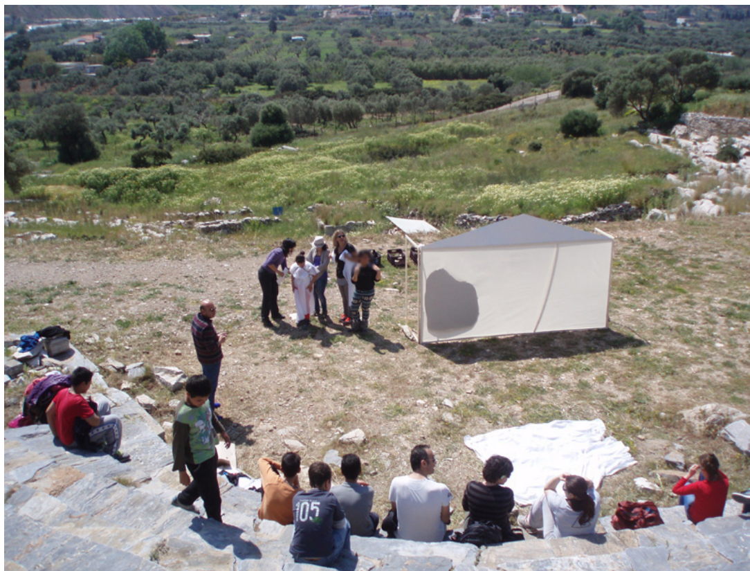
Το σκηνικό που στήθηκε στην ορχήστρα του αρχαίου θεάτρου του Θορικού

Το κυρίως σκηνικό του εικαστικού τμήματος της δράσης, η σύλληψη και η εκτέλεση του οποίου ανήκει στη μουσειακή ζωγράφο, αποτελείται από ένα καλά τεντωμένο, ημιδιάφανο, λευκό ύφασμα προσαρμοσμένο πάνω σε ξύλινο σκελετό, μιμούμενο την πρόσοψη του αετώματος του ναού του Ποσειδώνα στο Σούνιο, διαστάσεων 3,50 x 1,70 μέτρα, με επίσης ξύλινα ανοιγόμενα πλαϊνά στηρίγματα.