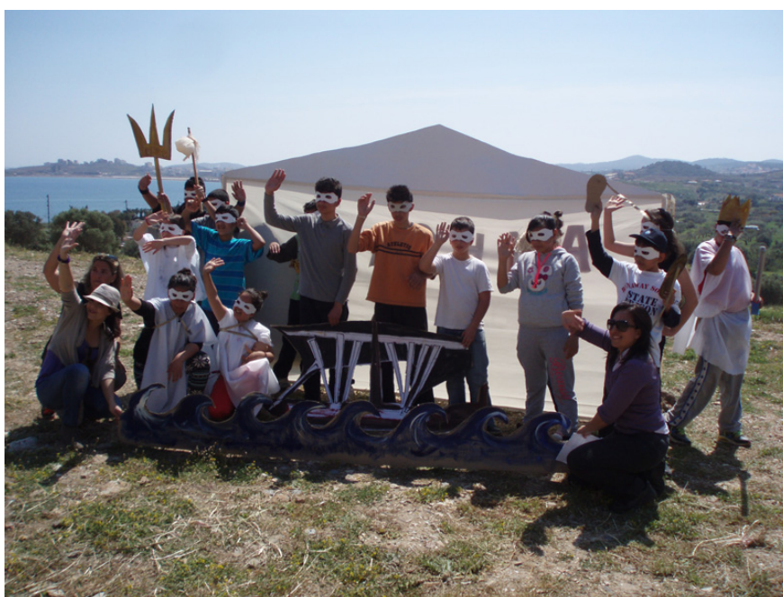
Οι συντελεστές της δράσης