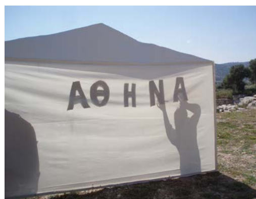
Οι μαθητές και οι μαθήτριες αναπαριστούν σκηνές από τη ζωή του Θησέα