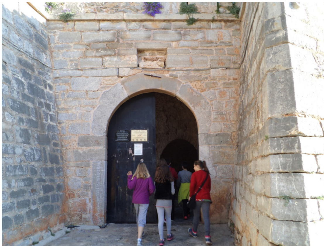
Πρώτη επίσκεψη στο Παλαμήδι: προμαχώνας του Μιλτιάδη

Οι μαθητές ταξίδεψαν σε τρεις διαφορετικές εποχές με βιωματικά παιχνίδια.