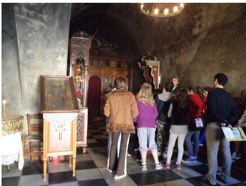
Δεύτερη επίσκεψη στο Παλαμήδι: εκκλησάκι του Αγίου Ανδρέα