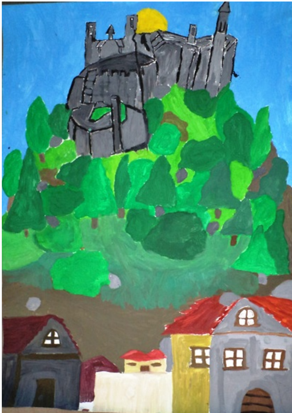
Το Παλαμήδι: ομαδικές ζωγραφικές δημιουργίες στο σχολείο.