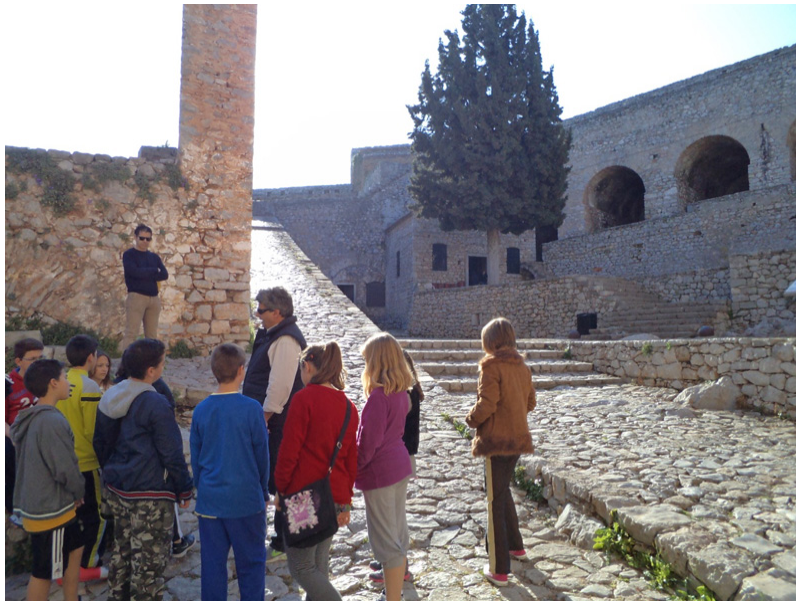
Δεύτερη επίσκεψη στο Παλαμήδι: προμαχώνας του Αγίου Ανδρέα