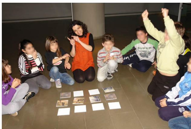
Εικόνα 5. Παίζουμε παιχνίδι μνήμης με κάρτες.

Πέμπτη 28 Μαρτίου: Με την επιστροφή στο σχολείο κι έχοντας νωπές τις εντυπώσεις, έγινε συζήτηση στην τάξη σχετικά με την επίσκεψη στο Τελλόγλειο. Οι μαθητές εξέφρασαν πολύ θετικά σχόλια για το όλο εγχείρημα και ανακάλεσαν αγαπημένες εικόνες και στιγμές του προγράμματος. Στη συνέχεια, τους ζητήθηκε να γράψουν στο σπίτι τους κάτι για την επίσκεψη και συγκεκριμένα ένα κείμενο στο οποίο θα μιλούσαν για το αγαπημένο τους έργο από τη συλλογή, το ζωγράφο, τους λόγους που το ξεχώρισαν.