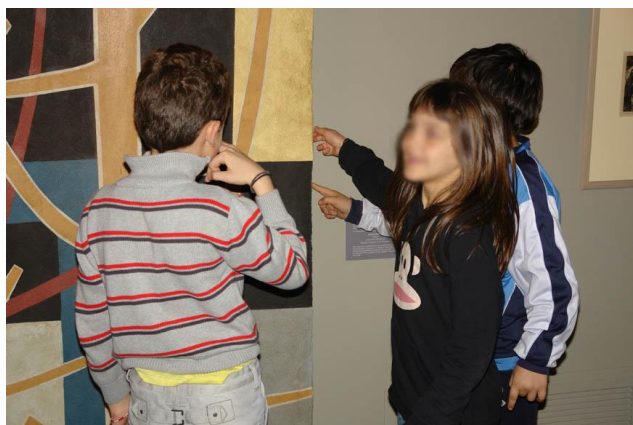
Εικόνα 2. Παρατηρούμε τα έργα του μουσείου.

Πέμπτη 28 Μαρτίου 2013 : Επίσκεψη της τάξης στο Τελλόγλειο. Οι μαθητές ξεναγήθηκαν στο χώρο του μουσείου αναγνωρίζοντας στοιχεία που είχαν μάθει από την επίσκεψη στο σχολείο. Στη συνέχεια περιηγήθηκαν στην έκθεση και συμμετείχαν ενεργά στη συζήτηση που προκαλούσε η υπεύθυνη του μουσείου. Ακολούθησε μια δημιουργική στιγμή όπου οι μαθητές ζωγράφισαν μια εικόνα νεκρής φύσης στον ειδικό χώρο που υπάρχει στο μουσείο και η επίσκεψη ολοκληρώθηκε με ένα παιχνίδι μνήμης που διασκέδασε τα παιδιά συνοψίζοντας γνώσεις, εντυπώσεις και εικόνες του προγράμματος. Κλείσαμε το πρωινό αυτό διαθέτοντας λίγο χρόνο για παιχνίδι στο χώρο της Πανεπιστημιούπολης και ολοκληρώνοντας έτσι μια όμορφη έξοδο από το σχολείο.