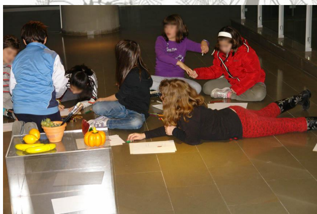
Εικόνα 3. Ζωγραφίζουμε έργα νεκρής φύσης.