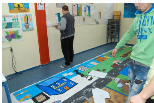
Εικόνα 9: Η σχολική αίθουσα ως εργαστήριο ζωγραφικής

Με βασικό στόχο τη συνεργασία, η ζωγραφική των έργων αυτών προχώρησε με δημιουργική διάθεση. Άδειασε μια τάξη και μετατράπηκε σε εργαστήριο ζωγραφικής. Στο πάτωμά της απλώθηκε το ένα έργο και στον τοίχο κρεμάστηκε το δεύτερο, ώστε να μπορούν οι μαθητές να δουλεύουν και στα δυο έργα ταυτόχρονα.