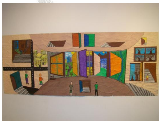
Εικόνα 6: «Ελευθερία είναι να έχω επιλογές»

Η δεύτερη εικόνα αφορά στις επιλογές. Μια φράση ενός μαθητή ήταν «Για μένα ελευθερία είναι να έχω επιλογές». Από αυτήν τη φράση γεννήθηκε η δεύτερη εικόνα.