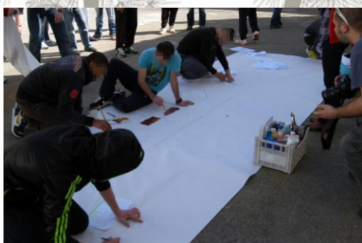
Εικόνα 8: Ομαδική ζωγραφική

Το επόμενο στάδιο της συνάντησης αυτής ήταν πρακτικό. Σε εκείνη την συνάντηση ξεκίνησαν οι μαθητές να βάζουν χρώμα στα δυο μεγάλα έργα. Απλώθηκαν τα έργα στην αυλή του σχολείου και προσκλήθηκαν όλοι οι μαθητές του Γυμνασίου και του Λυκείου να συμμετάσχουν στο χρωματισμό.