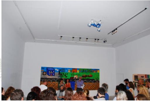
Εικόνα 11: Τα εγκαίνια της έκθεσης «Πέρα από τα όρια» στο ΕΜΣΤ

Αργότερα, ακολούθησε η καταγραφή του προγράμματος και των δραστηριοτήτων από τις υπεύθυνες καθηγήτριες.