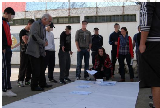
Εικόνα 4: Προετοιμασία για ομαδικό έργο

Τελικός στόχος ήταν να παραχθεί ένα μεγάλο σε διαστάσεις έργο, όπου όλα τα προσχέδια των μαθητών θα ενώνονταν σε μια εικόνα κάτω από το θέμα «Ελευθερία». Μέσα στις επόμενες εβδομάδες ακολούθησε συζήτηση με τους μαθητές ώστε να βρεθεί μια ενιαία εικόνα όπου όλα τα προσχέδια θα έβρισκαν τη θέση τους.