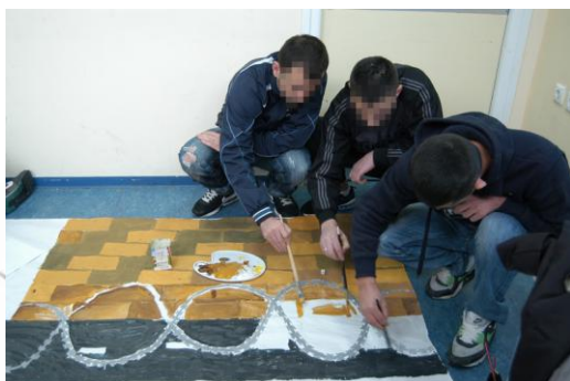
Εικόνα 7: Ο τοίχος της φυλακής

Όταν το σχέδιο τελείωσε, μια από τις ερωτήσεις που δέχτηκαν οι μαθητές - σχεδιαστές ήταν για ποιο λόγο ο ουρανός είναι τόσο λίγος, ενώ κάποιος θα περίμενε να είναι σχεδόν όλο το έργο ένας ουρανός, από τη στιγμή που το έργο πραγματεύεται την ελευθερία. Η απάντηση των μαθητών ήταν πως οι άνθρωποι έξω από την φυλακή όντως θεωρούν τον ουρανό ελευθερία, ενώ για εκείνους ισχύει πως δεν μπορούν να κοιτάξουν τον ουρανό χωρίς να δουν και κάγκελα ή σύρματα μαζί. Η πραγματικότητά τους είναι τα συρματοπλέγματα και οι τοίχοι, και ελευθερία για εκείνους είναι να διαβούν την πόρτα προς την κοινωνία.