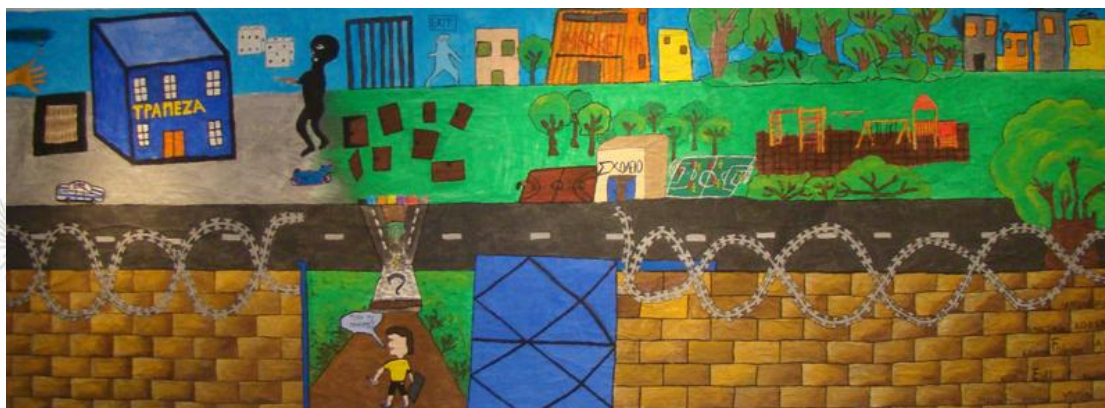
Εικόνα 5: «Και τώρα τι κάνω;»

Η δεύτερη εικόνα αφορά στις επιλογές. Μια φράση ενός μαθητή ήταν «Για μένα ελευθερία είναι να έχω επιλογές». Από αυτήν τη φράση γεννήθηκε η δεύτερη εικόνα.