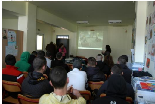
Εικόνα 1: Η επίσκεψη των επιμελητριών του ΕΜΣΤ στο σχολείο

σύγχρονων ελλήνων και ξένων καλλιτεχνών, που ανήκουν στις συλλογές του ΕΜΣΤ ή έχουν παρουσιαστεί σε εκθέσεις του. Μέσω των έργων οι μαθητές ήρθαν σε επαφή με εναλλακτικούς τρόπους καλλιτεχνικής έκφρασης, με διαφορετικές πρακτικές και υλικά, καθώς και με ένα εύρος θεμάτων. Ο διάλογος που αναπτύχθηκε με αφορμή τα έργα αποσκοπούσε στην αισθητική καλλιέργεια, την ευαισθητοποίηση, καθώς και την ενθάρρυνση της αυτοέκφρασης και της επικοινωνίας ανάμεσα στους μαθητές.