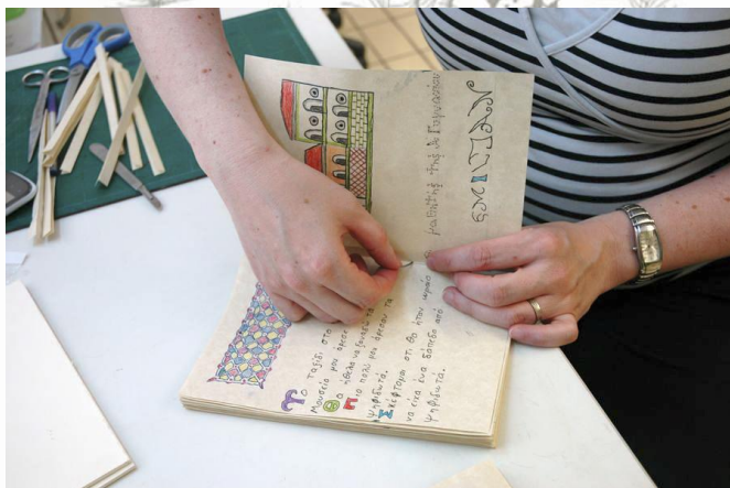
Εικόνα 8: Βιβλιοδεσία στο μουσείο

Μόλις όλα τα χαρτιά ήταν έτοιμα, τα παραδώσαμε στους μουσειοπαιδαγωγούς με τελικό προορισμό το εργαστήριο συντήρησης χάρτινων αντικειμένων του Μουσείου. Εκεί το εξειδικευμένο προσωπικό του μουσείου ανέλαβε να «δέσει» τις δημιουργίες των μαθητών σε κώδικα κατά το βυζαντινό τρόπο βιβλιοδεσίας. Η όλη διαδικασία (από την προετοιμασία των φύλλων μέχρι την τοποθέτηση των πινακίδων και τη διακόσμησή τους) τεκμηριώθηκε φωτογραφικά.