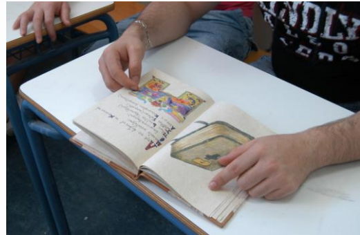
Εικόνα 10: Ξεφυλλίζοντας το Βυζαντινό Κώδικα

Τέλος, ακολούθησε η καταγραφή του προγράμματος και των δραστηριοτήτων από τις υπεύθυνες καθηγήτριες σε συνεργασία με τους μουσειοπαιδαγωγούς.