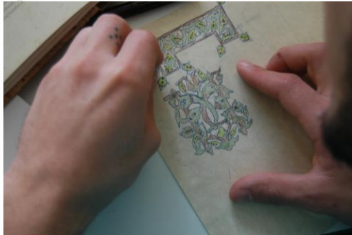
Εικόνα 4: Σχεδιάσμα πύλης για το Βυζαντινό Κώδικα

ολόκληρη τη σελίδα ένα σχέδιο από κάποιο βιβλίο που τους κίνησε το ενδιαφέρον. Εδώ πρέπει να σημειώσουμε τη σημαντική αρωγή που προσφέρθηκε από τους καθηγητές που ήταν συνοδοιπόροι σ' αυτή τους την προσπάθεια και τους κατεύθυναν διακριτικά, χωρίς να περιορίζουν τις ατομικές τους βουλήσεις και λειτουργώντας συμμετοχικά και συμμεριζόμενοι τη χαρά τους.