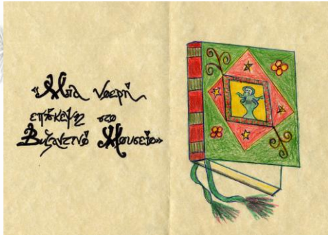
Εικόνα 6: Το αρχικό δίφυλλο

ξεκίνησαν τη διαδικασία από την αρχή. Πάλι αναζήτησαν στο διαδίκτυο ζωγραφιές και πύλες και έγιναν από την αρχή τα πρωτογράμματα και οι γραμματοσειρές.