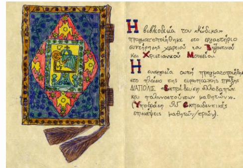
Εικόνα 7: Ένα ακόμη δίφυλλο

Μόλις όλα τα χαρτιά ήταν έτοιμα, τα παραδώσαμε στους μουσειοπαιδαγωγούς με τελικό προορισμό το εργαστήριο συντήρησης χάρτινων αντικειμένων του Μουσείου. Εκεί το εξειδικευμένο προσωπικό του μουσείου ανέλαβε να «δέσει» τις δημιουργίες των μαθητών σε κώδικα κατά το βυζαντινό τρόπο βιβλιοδεσίας. Η όλη διαδικασία (από την προετοιμασία των φύλλων μέχρι την τοποθέτηση των πινακίδων και τη διακόσμησή τους) τεκμηριώθηκε φωτογραφικά.