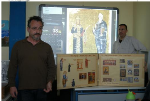
Εικόνα 1: Η επίσκεψη των εκπροσώπων του μουσείου στο Γυμνάσιο- Λύκειο του Ε.Κ.Κ.Ν.Α.

Επόμενο βήμα της συνεργασίας ήταν η επίσκεψη των μουσειοπαιδαγωγών στο σχολείο. Με τη χρήση της ιστοσελίδας του Βυζαντινού Μουσείου, που διευκόλυne μια εικονική περιήγηση στη μόνιμη έκθεση αλλά και στις επιμέρους συλλογές, σε εκδόσεις του μουσείου, καθώς και σε εκπαιδευτικό εποπτικό υλικό από το εκπαιδευτικό πρόγραμμα για τις φάσεις κατασκευής βυζαντινών χειρογράφων, αναπτύχθηκε μια δώρη συζήτηση. Τα θέματά της καθορίστηκαν σε μεγάλο βαθμό από τα ενδιαφέροντα των ίδιων των μαθητών. Συζητήθηκαν η έννοια του Μουσείου, η ιστορία και το περιεχόμενο του Βυζαντινού και Χριστιανικού Μουσείου, ζητήματα διαχείρισης, συλλογής, φύλαξης και έκθεσης μουσειακών αντικειμένων, καθώς και θέματα που σχετίζονται με την ανάγκη προστασίας και ανάδειξης της πολιτιστικής κληρονομιάς κάθε τόπου.