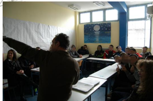
Εικόνα 2: Η συζήτηση με τους μαθητές

Επιδιώχθηκε η κατά το δυνατόν «ανοικτή» ερμηνευτική προσέγγιση των επιλεγμένων αντικειμένων με την ενεργητική συμμετοχή των μαθητών, την παρατήρηση, την ανάκληση προηγούμενων γνώσεων και εμπειριών, τη σύγκριση του άλλοτε με το παρόν. Έγινε προσπάθεια ένταξης των αντικειμένων/θεμάτων στο ευρύτερο πλαίσιο του βυζαντινού κόσμου ως ενιαίου, αλλά όχι ομοιόμορφου πολιτισμικού χώρου.