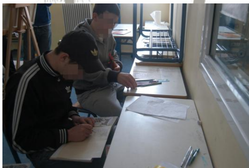
Εικόνα 3: Δουλεύοντας για το Βυζαντινό Κώδικα

Ως μέθοδο εφαρμογής ακολουθήσαμε την εξής διαδικασία: Αρχικά διπλώσαμε τα χαρτιά τύπου περγαμηνής και μεγέθους Α4 στη μέση και αποφασίσαμε να φτιάξουμε μια πύλη σε κάθε δίφυλλο και στο τέλος ένα ακόμα σχέδιο. Ο κάθε μαθητής ξεφύλλισε τα βιβλία που μας χάρισε το μουσείο και από τον διαδικτυακό τόπο του μουσείου «κατεβάσαμε» πύλες από διάφορα βυζαντινά χειρόγραφα. Έπειτα, ο κάθε μαθητής επέλεξε ένα σχέδιο και με τη βοήθεια καρμπόν σχεδίασε την πύλη του στην αρχή του δίφυλλου του. Λόγω των λεπτεπίλεπτων και περίτεχνων σχεδίων απαιτούνταν από τους μαθητές υπομονή και μεράκι, που διέθεσαν σε υπέρτατο βαθμό και έφτασαν να αποδώσουν τον καλύτερό τους εαυτό. Σε αρκετές περιπτώσεις ήταν τόση η ενάργεια τους που ξεπέρασαν και αυτές τις μικρές προσδοκίες τους και ένιωσαν δικαιωμένοι από το αποτέλεσμα που πρόσφεραν στον εαυτό τους και σε όλους εμάς.