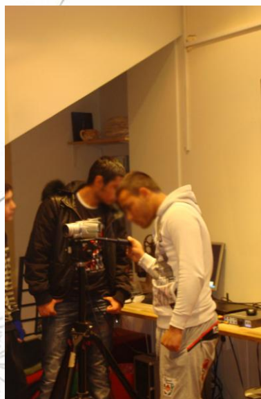
Εικόνα 2: Περιεργαζόμαστε την κάμερα