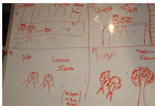
Εικόνα 4: Στόργυ μπορντ