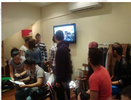
Εικόνα 1: Στην αίθουσα εκπαιδευτικών προγραμμάτων του μουσείου

8. 1η επίσκεψη μαθητών στο Μουσείο Κινηματογράφου (08/03/2013): γνωριμία με τα εκθέματα του Μουσείου – βιωματικό εργαστήριο με θέμα: «Μπροστά και πίσω από τις κάμερες».