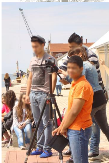
Εικόνα 9: Πώς να πετύχουμε το πλάνο