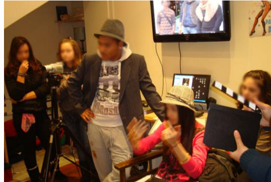
Εικόνα 6: Φώτα, κάμερα, πάμε!