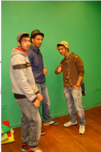
Εικόνα 5: Στο πράσινο δωμάτιο