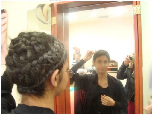
Εικόνα 7: Ετοιμασία για το γύρισμα

17. 2η επίσκεψη μαθητών στο Μουσείο Κινηματογράφου (14/05/2013): Γυρίσματα κινηματογραφικής ταινίας.