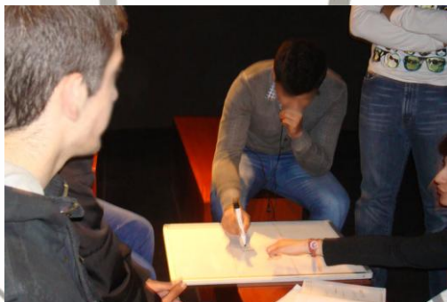
Εικόνα 3: Κατασκευή στόργυ μπορντ