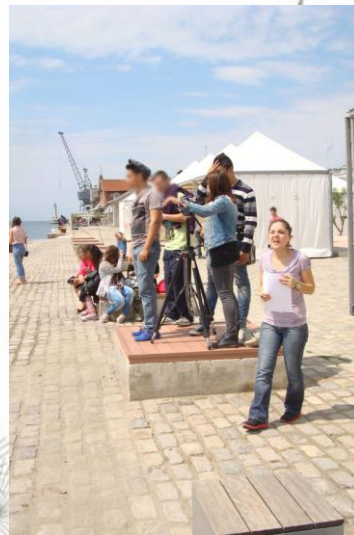
Εικόνα 8: Το γύρισμα της ταινίας