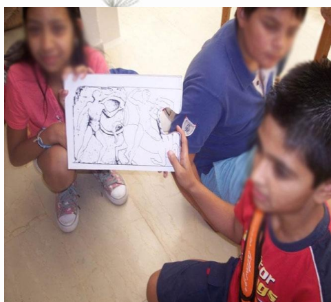
Εικόνα 7: Κέρδισα ένα κομμάτι του παζλ