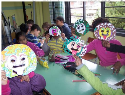
Εικόνα 3: Με τις μάσκες της Μέδουσας