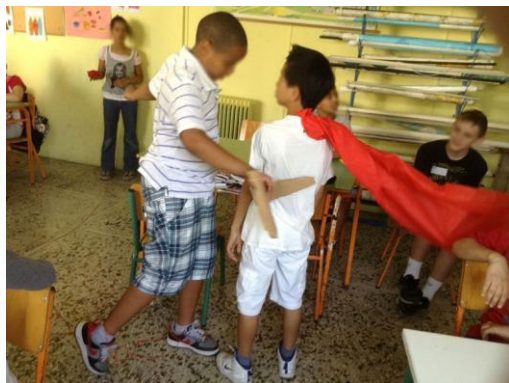
Εικόνα 10: Δραματοποίηση