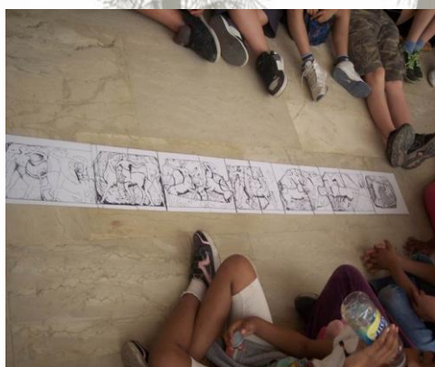
Εικόνα 8: Το παζλ με τη ζωφόρο του ναού του Ποσειδώνα