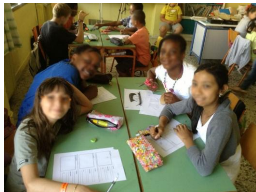
Εικόνα 11: Δημιουργία στόρου μπορντ