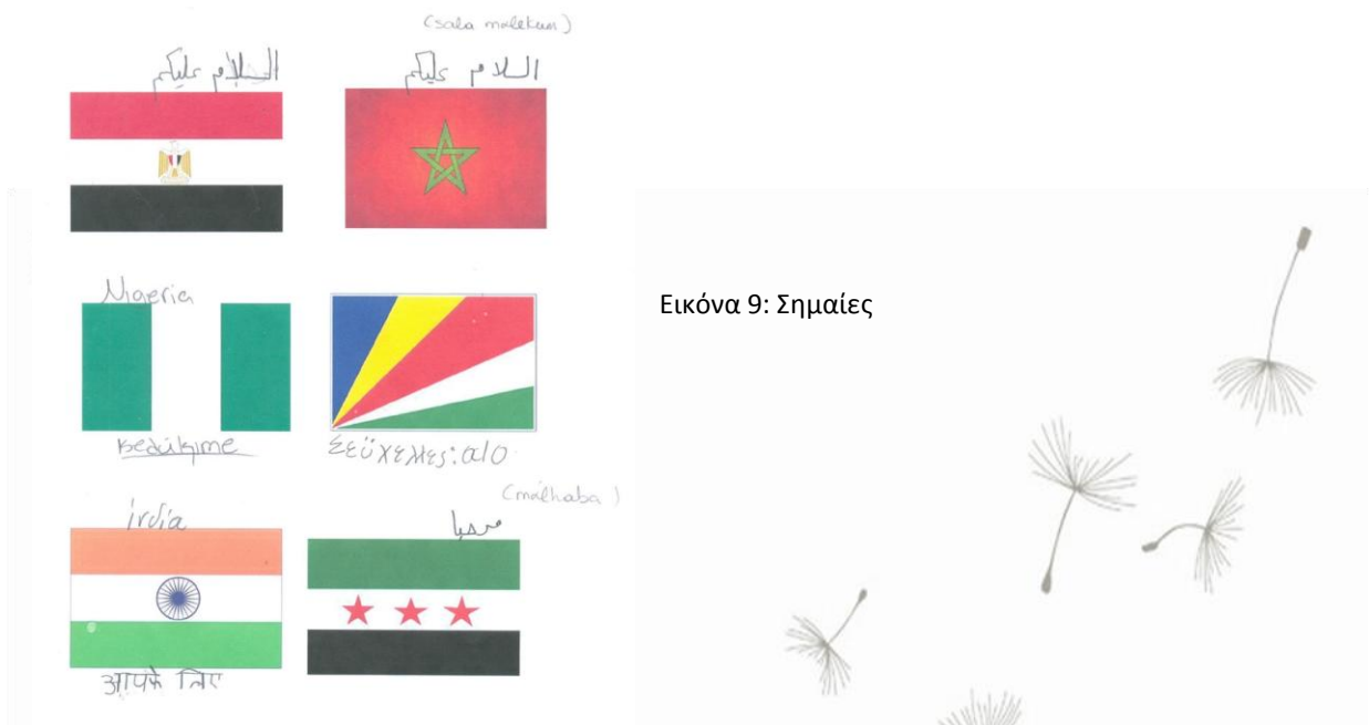
Εικόνα 9: Σημαίες