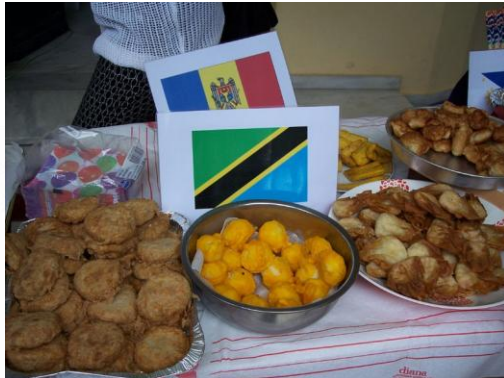
Εικόνα 15: Φαγητά από όλο τον κόσμο