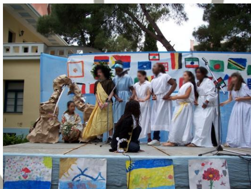
Εικόνα 14: Η «Ειρήνη» του Αριστοφάνη