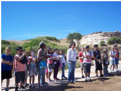
Εικόνα 5: Επίσκεψη στο Σούνιο