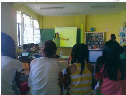
Εικόνα 4: Η αρχαιολόγος στο σχολείο μας