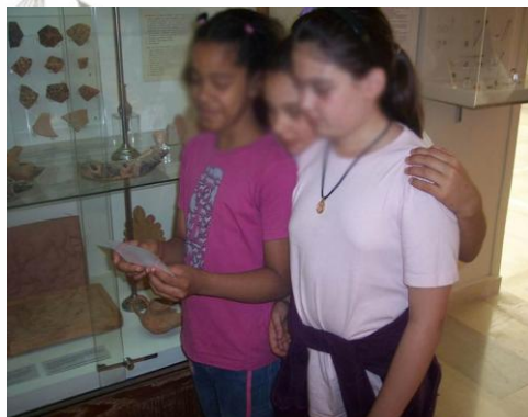
Εικόνα 6: Παιχνίδι με τις κάρτες-αινίγματα