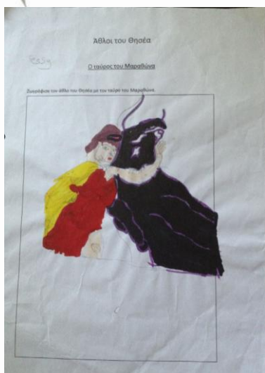
Εικόνα 1: Ο ταύρος του Μαραθώνα