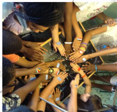
Εικόνα 13: Όλοι μαζί